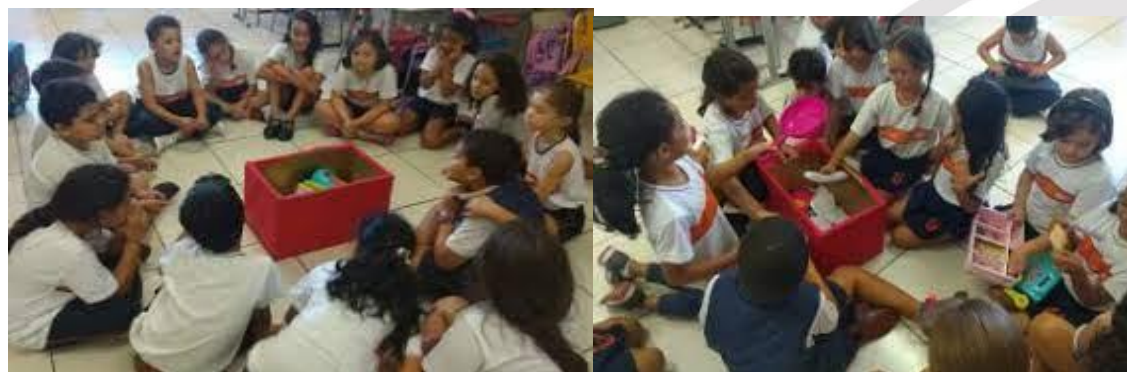
Massinha de modelar