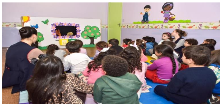
Brincadeira das Profissões